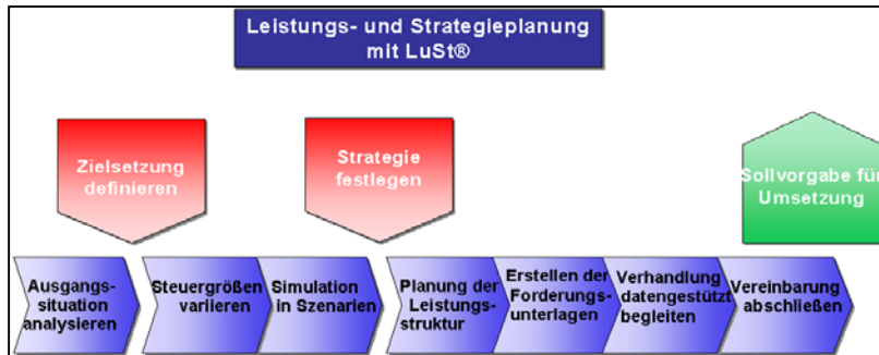
Von der Zielsetzung zur Umsetzung – Der Leistungsumfang von LuSt

Nutzen Sie die Filter- und Analysemöglichkeiten in LuSt, um zielgenau ihr Risikopotenzial identifizieren und mit einer geeigneten Leistungsstruktur Gegenstrategien entwickeln zu können.